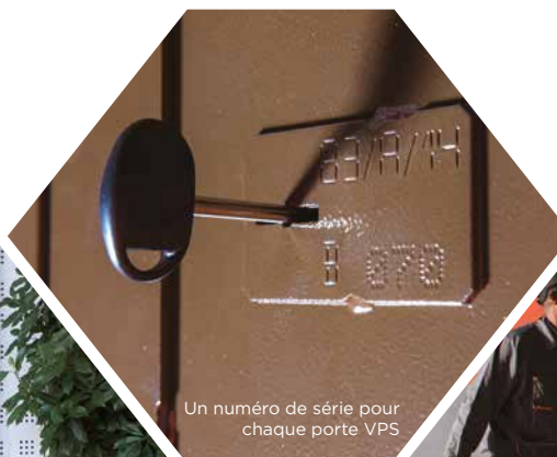
Un numéro de série pour chaque porte VPS