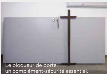
Le bloqueur de porte, un complément-sécurité essentiel.

Pour lutter contre les tentatives d'occupation illégale, ce système empêche le regondage de la porte d'origine. Ainsi, le logement perd toute attractivité pour les éventuels squatteurs, qui ne peuvent plus installer de fermeture sur le palier.